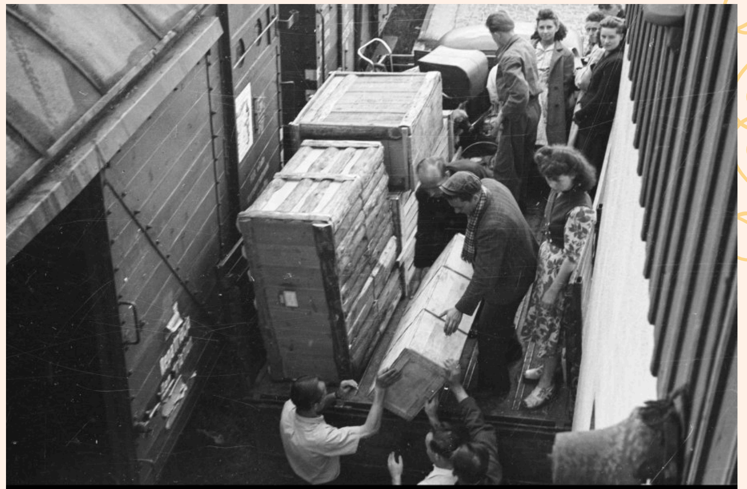
Narodowe Archiwum Cyfrowe